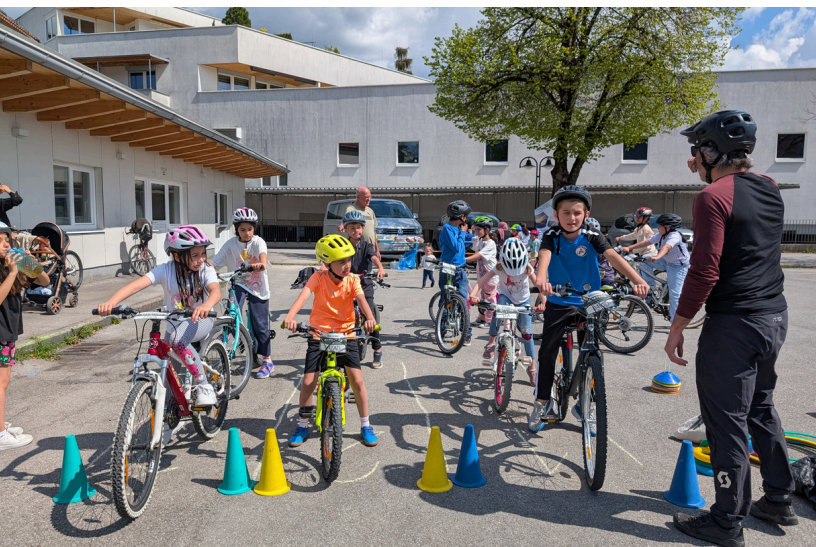
RADFAHRTRAINING IN DER FREIWillIGENWoCHE

FREIWillIGENZENTRUM UND LEADER-PROJEKT GEMEINWOHL