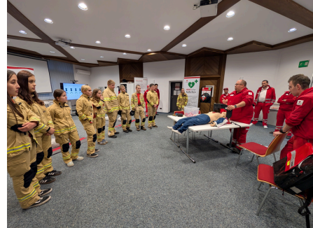
VIELFALT IM EHRENAMT