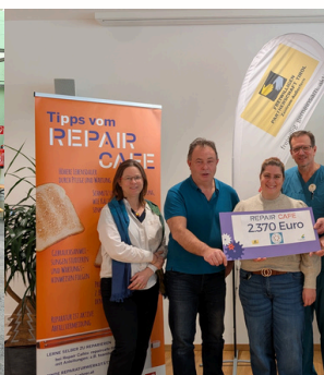
REPAIR CAFE HELFER-TEAM, SPENDENÜBERGABE UND SPRACHFÖRDERUNG MIT HERZ