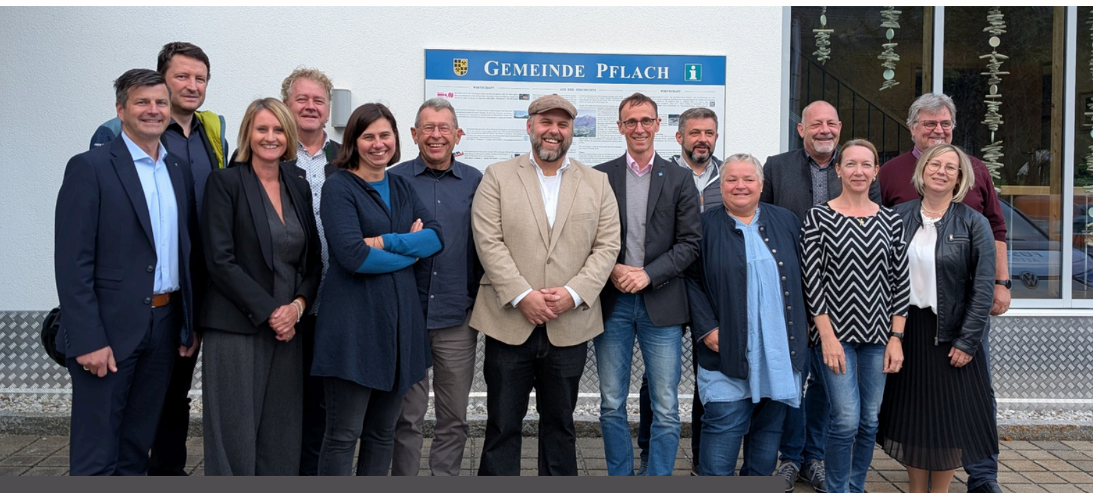
REA-VORSTAND NACH DER NEUWAHL IM OKTOBER 2025

Den Verein Regionalentwicklung Außerfern (kurz REA) gibt es schon seit 1995. Gegründet wurde REA, um die Entwicklung des Bezirks Reutte voranzubringen. REA ist vor allem eine Plattform für sektor- und gemeindeübergreifende Zusammenarbeit. Mitglieder im Verein sind Gemeinden, Tourismusverbände, Sozialpartner, Banken, Unternehmen und Privatpersonen. Wichtige Entscheidungen werden vom 19-köpfigen Vorstand getroffen.