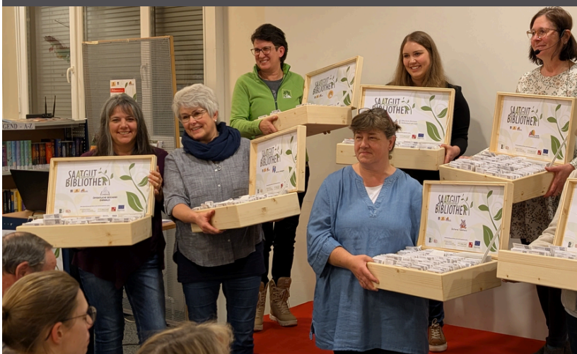
PRÄSENTATION AUSSERFERNER SAATGUTBIBLIOTHEK

Ziel der Arbeit im FWZ war in diesem Jahr, freiwilliges Engagement im Bezirk sichtbar zu machen, zu fördern und nachhaltig zu stärken.