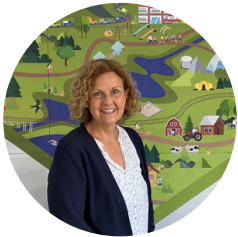
EVI KELLER FREIWILLIGENZENTRUM UND PROJEKT GEMEINWOHL